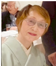
そこそこ亭よい子 様