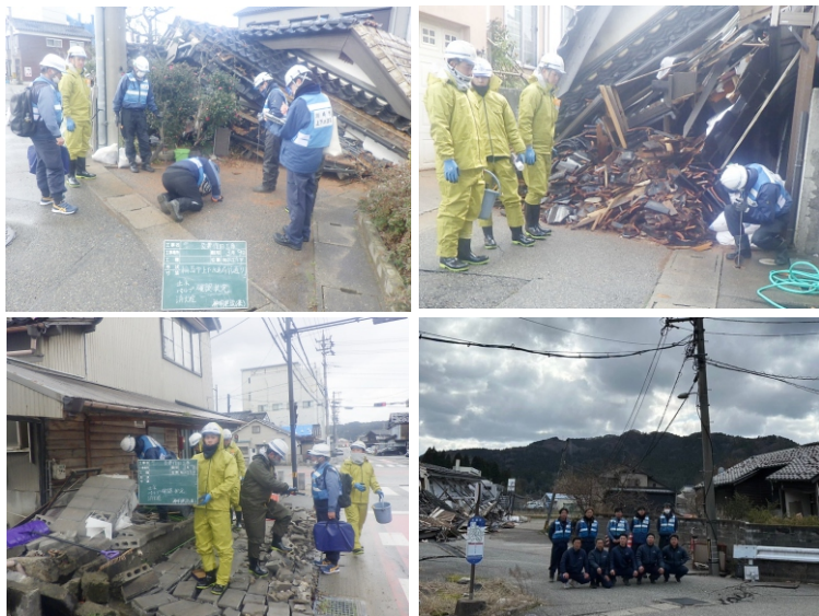
令和6年には能登半島地震の災害派遣・復興支援に行った。