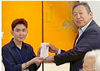
有志会員によるクラブ奨学金の授与